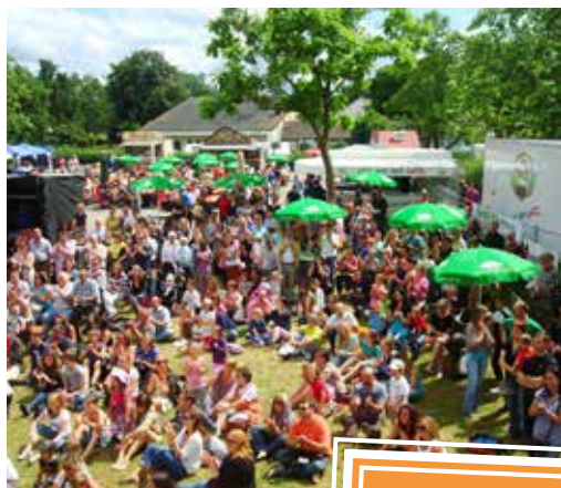
„Kultur Nordwest“ 2013

Die „Junge Nordweststadt-Kultur“ aus Schulen und Hort wird Sie überraschen. „Rocken“ Sie