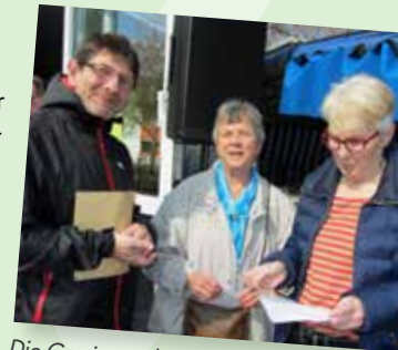
Die Gewinner des Rätsels aus Heft 1

Allen Gewinnern gratulieren wir herzlich.