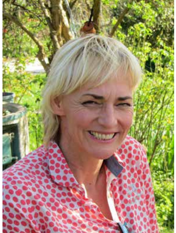
Heike Drechsler während des Interviews

Mit dem Frühling kommt Bewegung in den Stadtteil. Feste werden gefeiert, man trifft sich im Freien, sitzt im Biergarten oder Straßencafé. Aber kommt auch der Mensch selbst in Bewegung? Was macht uns fit für die schönste Jahreszeit? Die Redaktion hat bei Heike Drechsler, einer der erfolgreichsten Leichtathletinnen aller Zeiten nachgefragt. Seit 18 Jahren wohnt sie hier in der Nordweststadt. Drechsler kam seinerzeit des Sports und auch der Liebe wegen nach Karlsruhe, suchte die Nähe zu Frankreich. Sie ist 50 Jahre jung und strahlt noch immer eine ungeheuer ansteckende Lebensfreude und Energie aus.