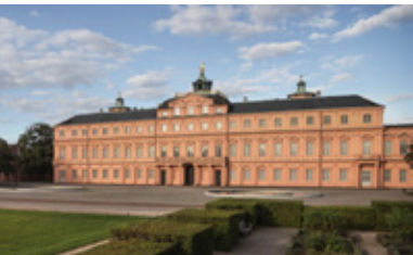
Foto: Residenzschloss Rastatt